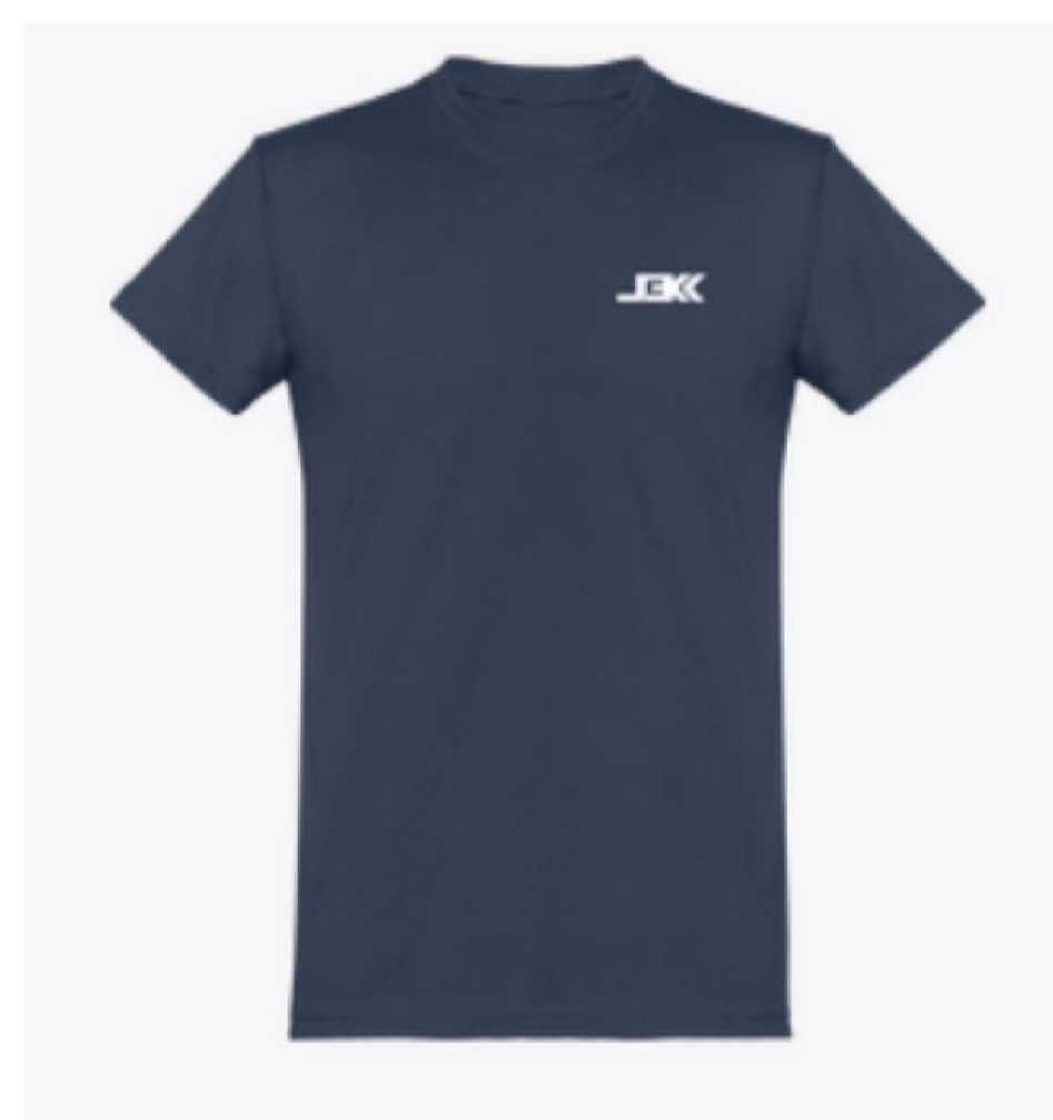
T-Shirt Logo Blanc