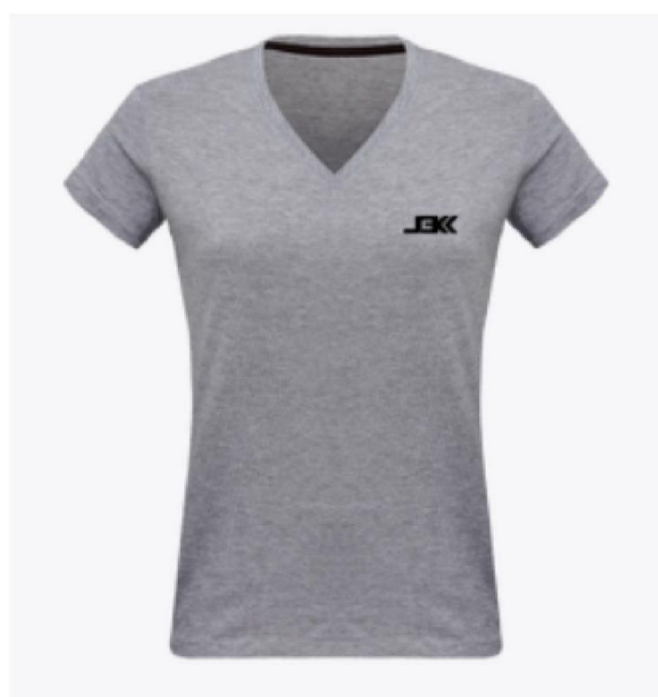
T-shirt Femme logo noir