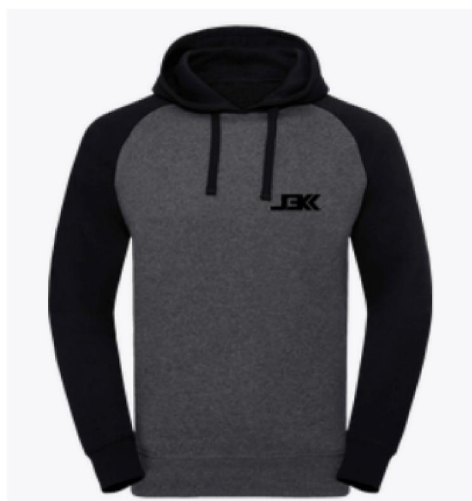
Sweat stretch logo j3k noir