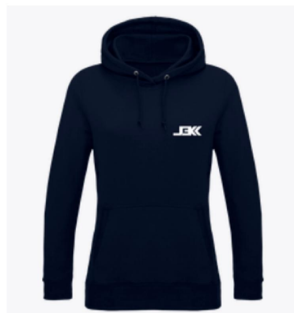
Sweat Femme logo blanc