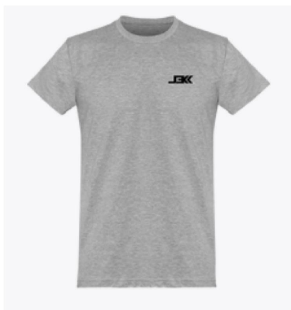
T-Shirt Logo Noir